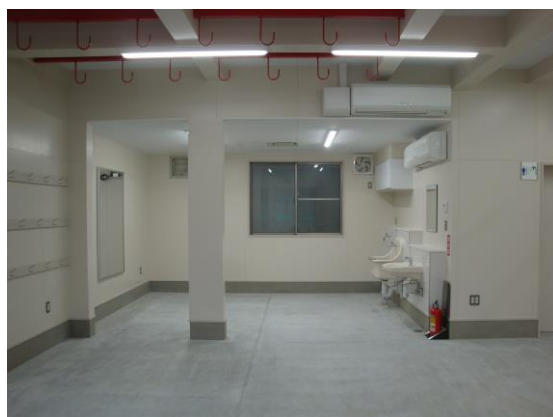
ウェイトトレーニングコーナー