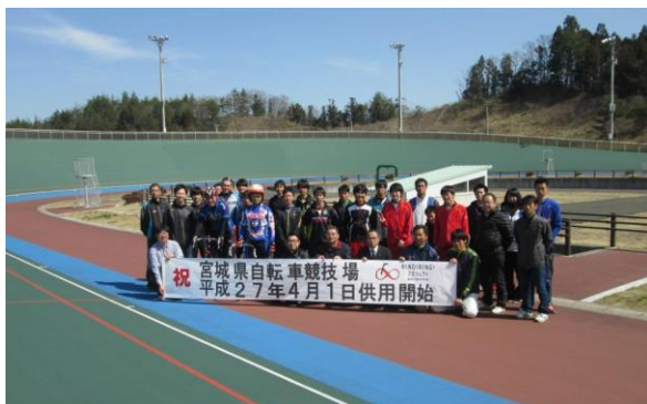
プロ・アマ参集による 供用開始記念写真