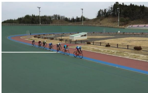
走路改築後の使用風景